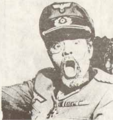
BIGEARD AU PARLEMENT