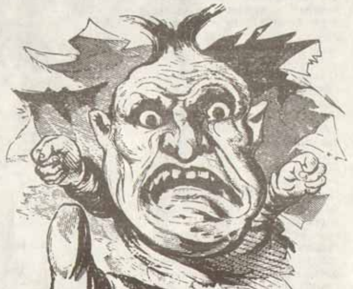
CHIRAC ET LES COMITES DE SOLDATS