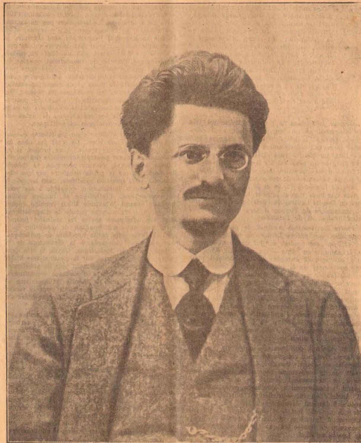
Cette photographie de l'auteur de "1905" a été prise à Vienne, un an avant la guerre.