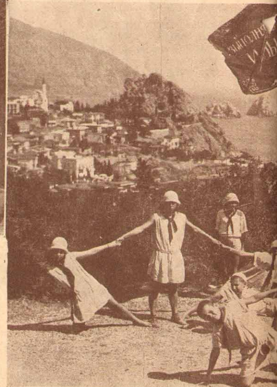
Enfants paysans se reposant en Crimée sur

Là, les écoles étaient souvent les seuls et uniques centres d'éducation et d'instruction. Les enfants répandaient ce qu'ils y apprenaient. Ils enseignaient à leurs parents les connaissances acquises. Il était important de bien utiliser cette influence naturelle, de l'am-