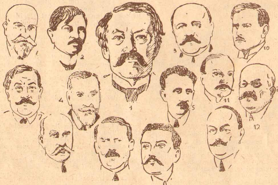
Le Ministère français. — 1. A. Briand. — 2. Painlevé. — 3. Loucheur. — 4. R. Renoult 5. C. Chautemps. — 6. J. Durand. — 7. P. Painlevé. — 8. G. Leygues. — 9. Daniel Vincent. 10. Daladier. — 11. De Monzie. — 12. Périer. — 13. Jourdain. — 14. Durafour.

Va-t-on vers une dissolution du Parlement après le rétablissement du scrutin d'arrondissement ? Ou verrons-nous durer le présent ministère malgré la crise financière ? Nul ne sait. L'avenir nous répondra.