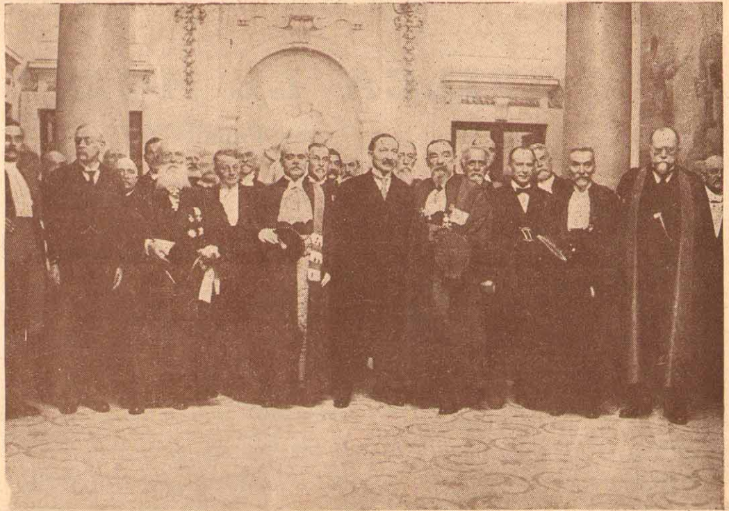
M. Yvon Delbos, entouré des docteurs « Honoris causa ». Sir Edward Gosse, sir Rutherford, le professeur Pavlov (I). Dans l'assistance, Christian Rakowsky (II), ambassadeur de l'Union des Républiques Socialistes Soviétiques

de peuple à peuple sont beaucoup moins tendues.